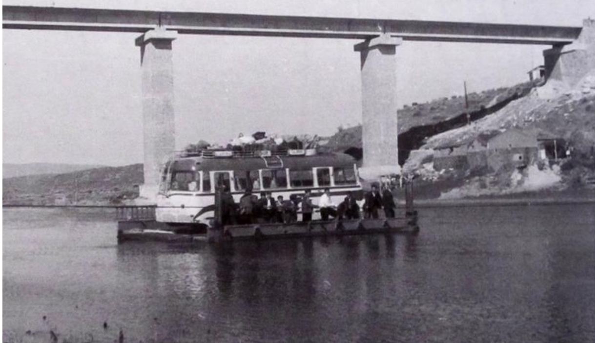
https://www.facebook.com/photo/?fbid=10220015133963556&set=g.417268942221245 Bus_(Cruzando Rio)_(HistTransViajEsp)_(2023-04-14)===

Autobús de La Campillana cruzando el río Guadiana en barcaza, antes de terminar el puente de la N-502 en el tramo de Castilblanco a Herrera del Duque