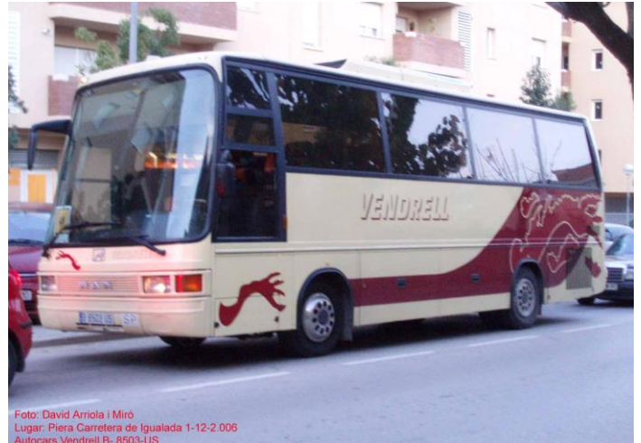
Lugar: Piera Carretera de Igualada 1-12-2-006 Autocars Vendrell B-8503-US