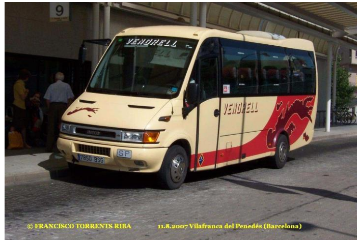
11.8.2007 Vilafranca del Penedés (Barcelona)