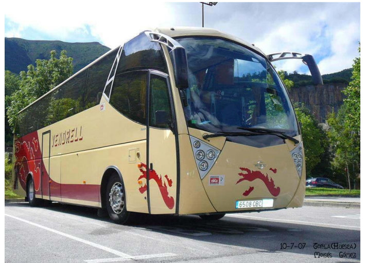
10-7-07 GORLA (Huesca) Piera Carretera de Igualada