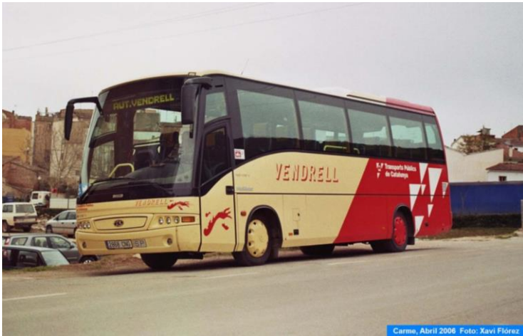
Carme, Abril 2008