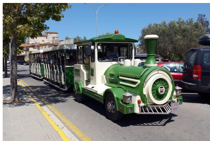
PALS (E 6005 BDS) El Xiulet de Pals (Miquel) 7-8-17 b