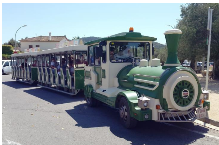
PALS (E 6005 BDS) El Xiulet de Pals (Miquel) 7-8-17 a