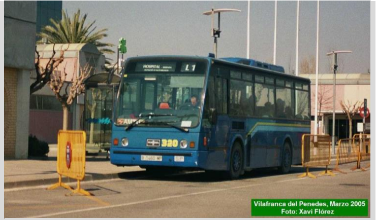
Vilafranca del Penedés, Marzo 2005