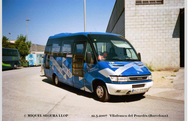
12.5.2007 Vilafranca del Penedés (Barcelona)