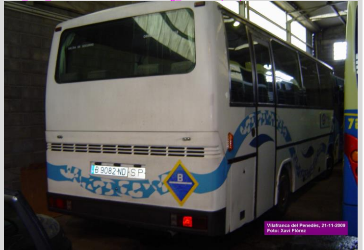
Vilafranca del Penedés, 21-11-2009