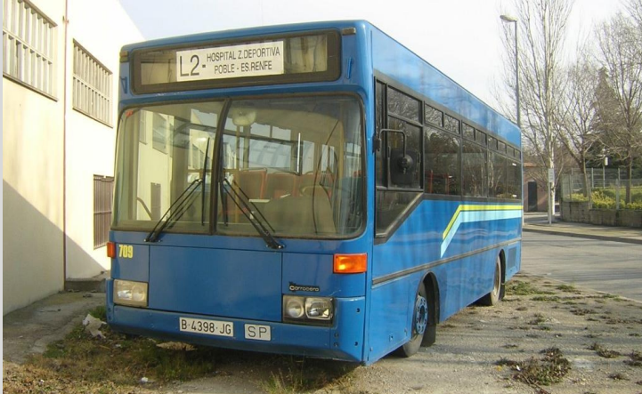
Foto: CARLOS MARTÍNEZ PÉREZ EXTERIOR COTXERA TCC (VILAFRANCA DEL PENEDÉS), 3 DE FEBRER DE 2007