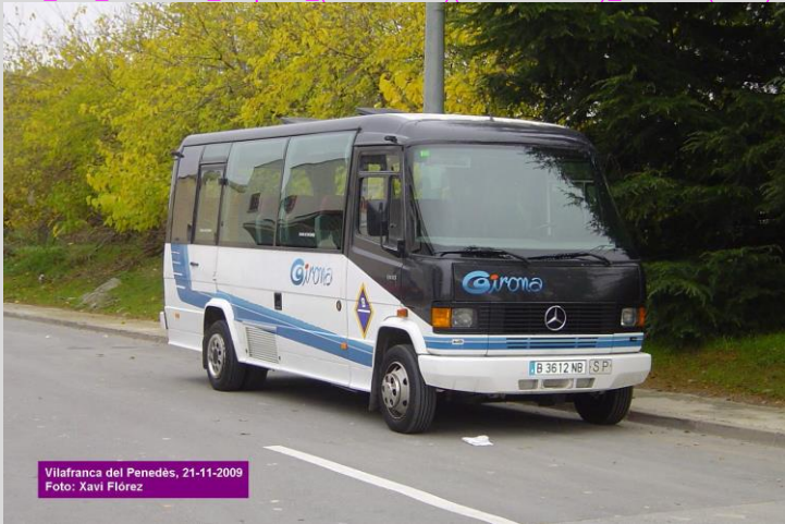
Vilafranca del Penedés, 21-11-2009