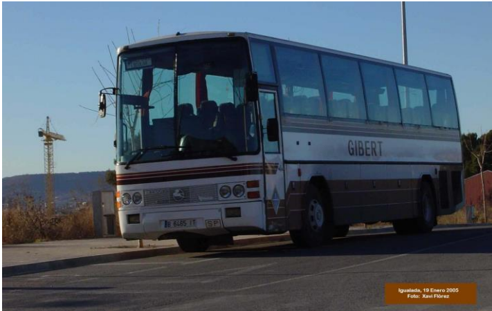
Iguialada, 19 Enero 2005