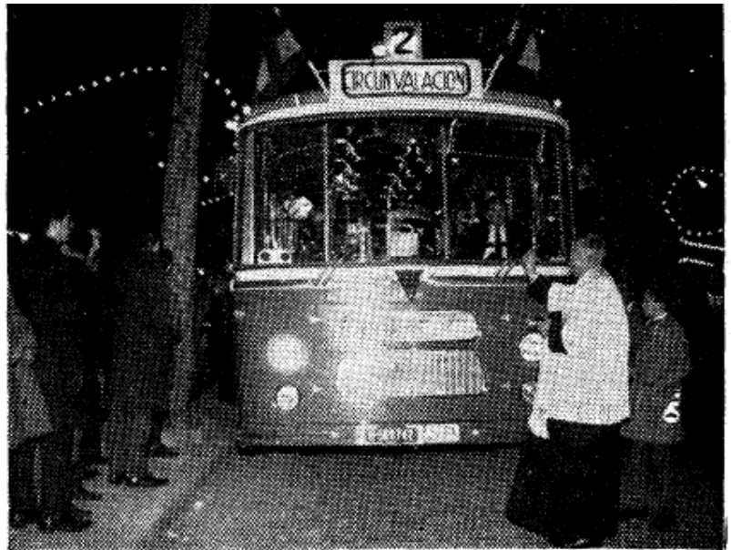
Acto de la bendición e inauguración de los autobuses que han entrado a cumplir un destacado servicio en la ciudad.