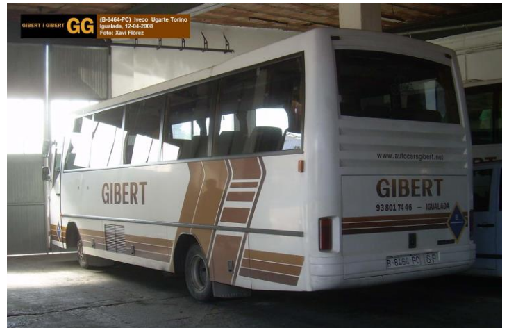
GIBERT | GIBERT GG (B-8464-PC) Iveco Uptare Torino Iguialada, 12-04-2009