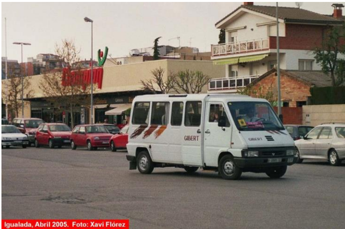
Iguialada, Abril 2005.