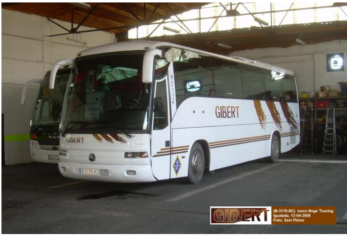
GIBERT (B-3176-SP) Iveco Hoga Touring Iguialada, 12-04-2009