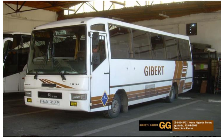
GIBERT | GIBERT GG (B-8464-PC) Iveco Uptare Torino Iguialada, 12-04-2009