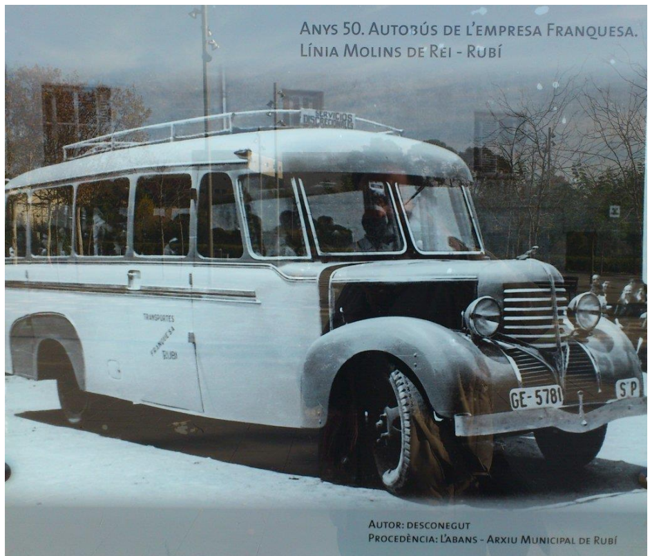
ANYS 50. AUTOBÚS DE L'EMPRESA FRANQUESA. LÍNIA MOLINS DE REI - RUBÍ

http://cv.uoc.es/~imora/lineas_i/img_tarrasa-svicente/franquesa.jpg