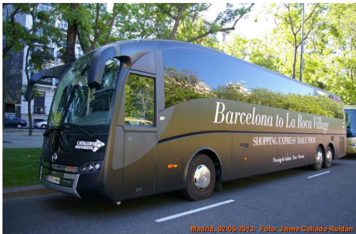
Bus_3212 de Alsa