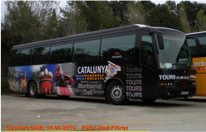
Cochera UAB, 14-04-2010. Puede verse la nueva decoración negra.