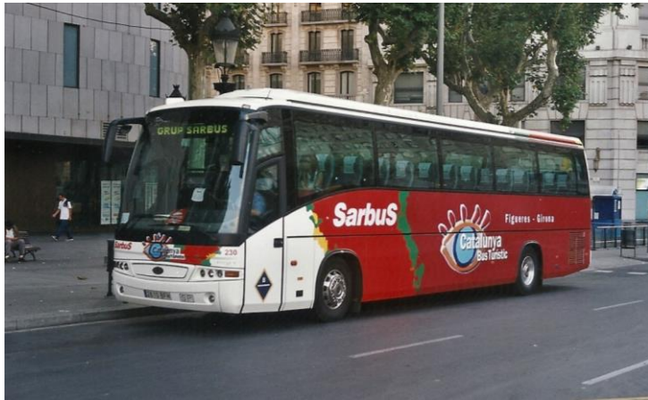
(año2003) Bus_230_Renault-FR1_Beulas-Stergo_(Javier Guimera) Puede verse el primer tipo de decoración roja, mostrando las empresas