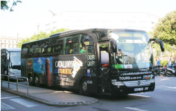
(año2013)_ Bus_2436=Alsa_12-06-13_Francesc Xandri