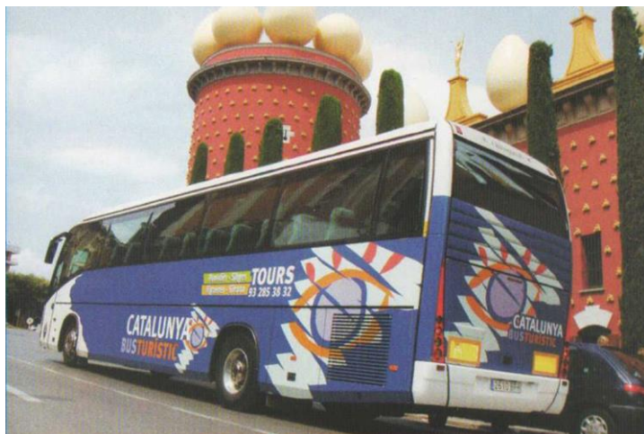
(año 2005) Segundo tipo de decoración, en color azul. (Reproducción de un prospecto de la empresa).