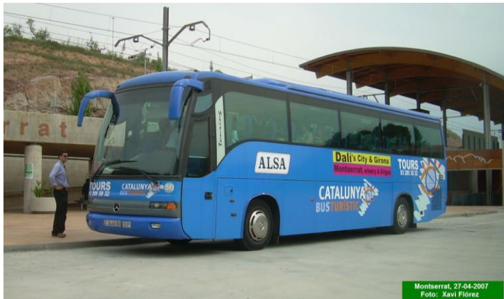
(año2007) Bus_1593 (Z-2446-BG) MB-Noge-Touring_2007-04-27(XF)