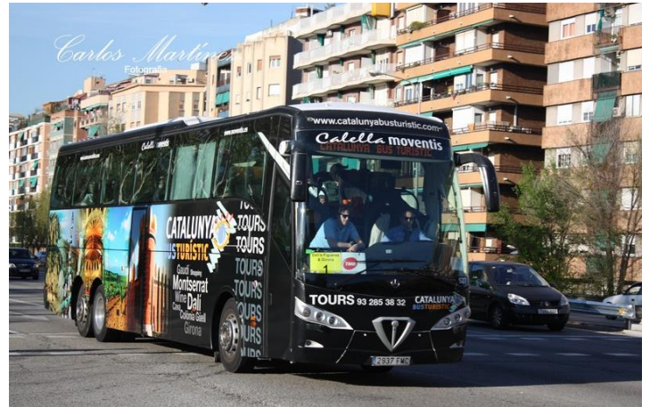
(año2013)_ Bus_527_MB_Noge Touring III (2013-04-17 Av.Meridiana