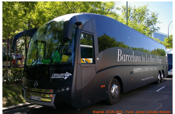
Bus_3213 de Alsa