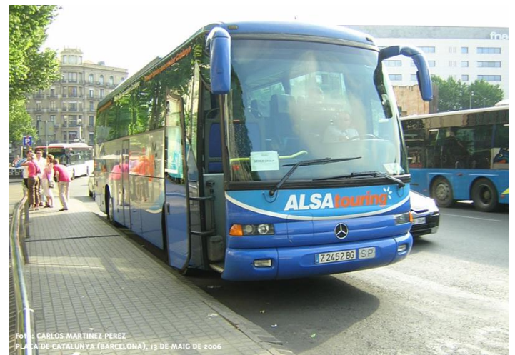
PLAZA DE CATALUNYA (BARCELONA), 13 DE MAIG DE 2006