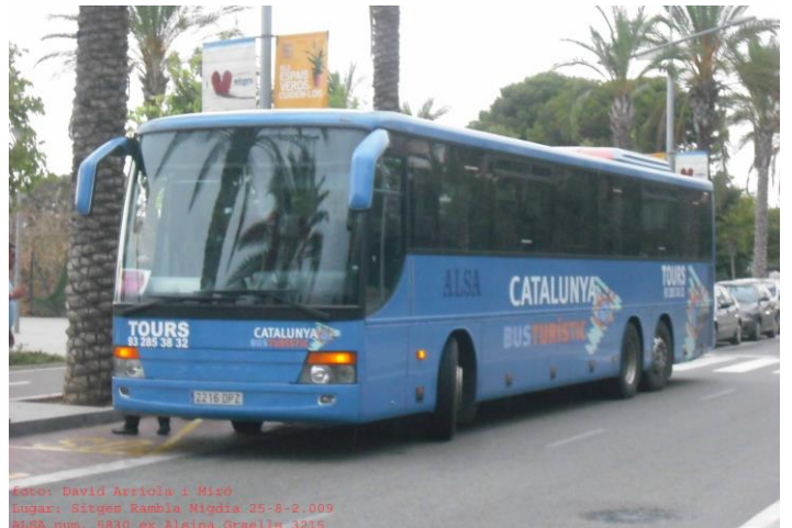
Lugar: Sitges Rambla Miquel 25-8-2.009 ALSA num. 2820 ex Aleina Graells 2225