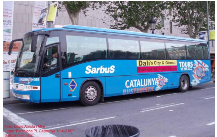
Lugar: Barcelona Pl. Catalunya 19-4-2.007 Sarbus num. 382