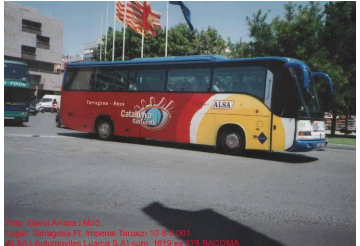
Lugar: Tarragona Pl. Imperial Tarraco 10-8-2.001 ALSA (Automoviles Luarca S.A) num. 1619 ex 278 BACOMA