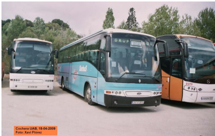
(año2009) Bus_230_Renault-FR1 Beulas-Stergo (Sarbus)_2009-04(XF)