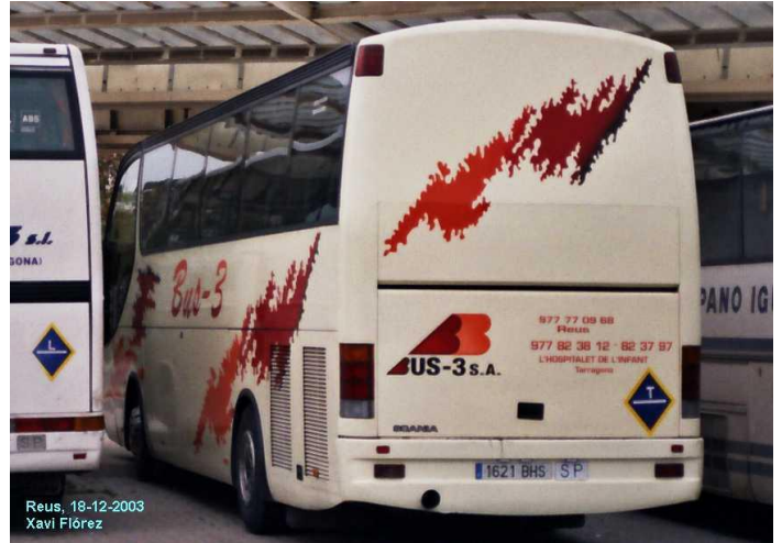
Reus, 18-12-2003