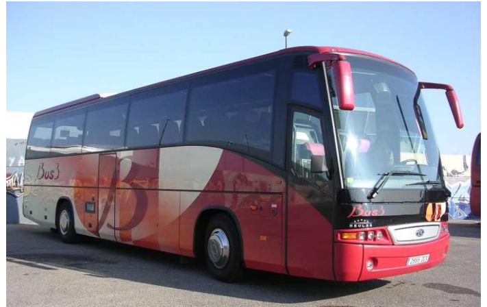
Bus_(2665-DCX) Beulas Stergo'E_2005-02 (Javier Peña)