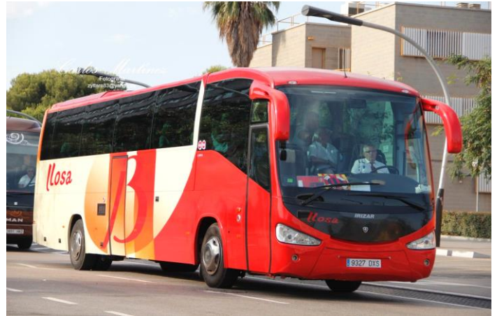
Bus_(9327-DXS)=(2013-08-02 Barça-Santos