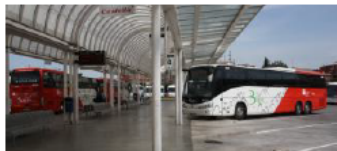
Autobusos de Bages Expres a l'estació de Manresa

La línia de bus entre Manresa i Barcelona serà operada per la Hispano Igualadina. Així ho ha dictaminat el Tribunal Suprem, que ha rebutjat els recursos de la Generalitat i de la UTE Bages Expres (integrada per Castellà, Alsina Graells i Julià) presentats contra la sentència del TSJC, que donava el servei a la Hispano.