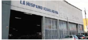
Instal·lacions de l'empresa Hispano Igualadina ACN

El canvi d'operador del servei de bus entre Manresa i Barcelona serà efectiu el dissabte 17 de desembre, el mateix dia que deixarà de prestar-lo la UTE Bages Exprés.