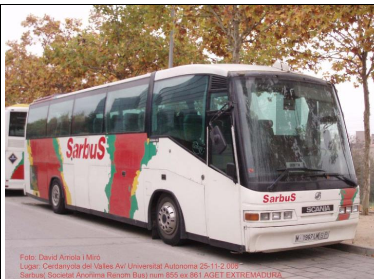
Lugar: Cerdanyola del Valles Av/ Universitat Autònoma 25-11-2.006 Sarbus( Societat Anònima Renom Bus) num 855 ex 861 AGET EXTREMADURA

Este no es ex Aget, pero es idéntico a ellos y contemporaneo.