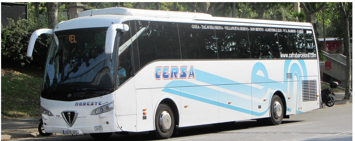
del 19-07-2013 → VER LAS ROTULACIONES Y LOGOS (Una imagen vale más que 1000 palabras).

Esta ficha se actualizó anteriormente en profundidad el 10-2010 y en esta nueva versión se han modificado los estilos del Historial y se ha agregado alguna nota posterior.