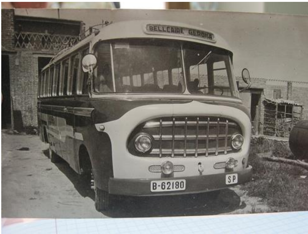
Un autocar d'en Joaquim Puig i Casadellà en una excursió amb canalla: