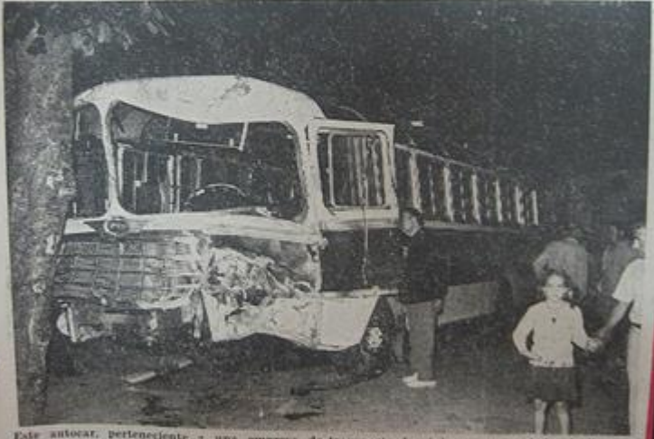
Este autocar, perteneciente a una empresa de transporte de viajeros, que acababa de llevar a San Hilario Sacalm a los componentes de la cobla-orquesta «La Principal de Llagostera», pudo ocasionar una auténtica catástrofe en la Villa de las Cien Fuentes, al fallarle los frenos y emprender una peligrosísima carrera cuesta abajo por todo el sector de la población. El conductor y un acompañante resultaron heridos y los daños materiales en las calles y en varios vehículos fueron importantes.