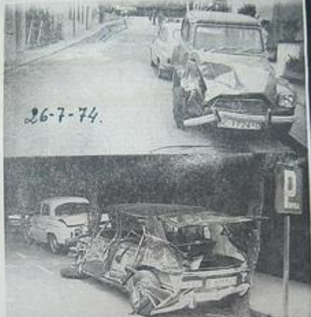
En esta calle se quedó helado el conductor al intentar dar vuelta. El turismo del ITIN se fue al primer golpe. Ya en la avenida, se chocó igualmente entre otros dos turismo de San Hilario.

Pudo ocasionar una catástrofe, pero causó dos heridos y muchos daños materiales