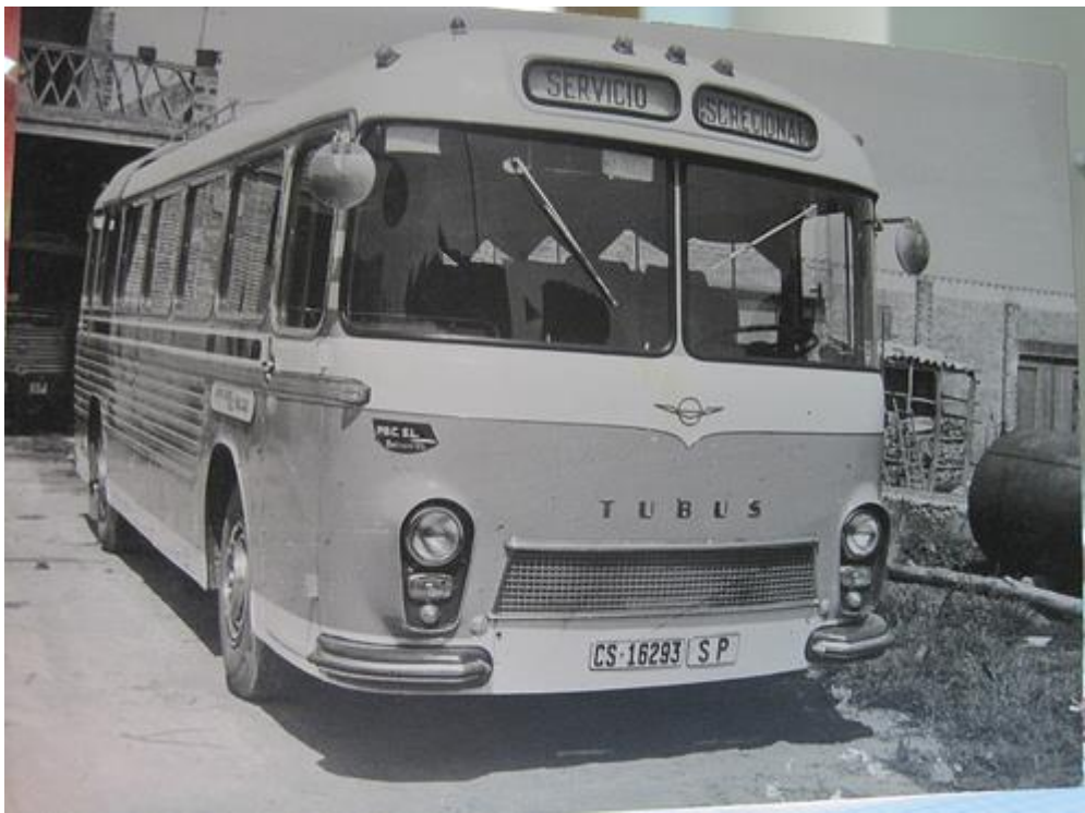
Una altre fotografia del TUBUS: