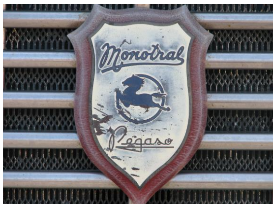
GIVEROLA B-816.934 - 31 - JCV - 11-10-2008 - Tossa de Mar