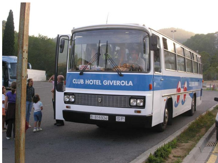
Bus (GIVEROLA B-816934) 2004-10-09 Uno de los primeros avistamientos de que se tiene noticia, en el año 2004.

Este vehículo lleva muchos años años haciendo el servicio del "Club Hotel Giverola":