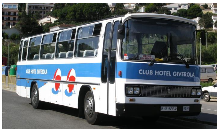
GIVEROLA B-816.934 - 06 - JCV - 08-10-2005 - Tossa de Mar