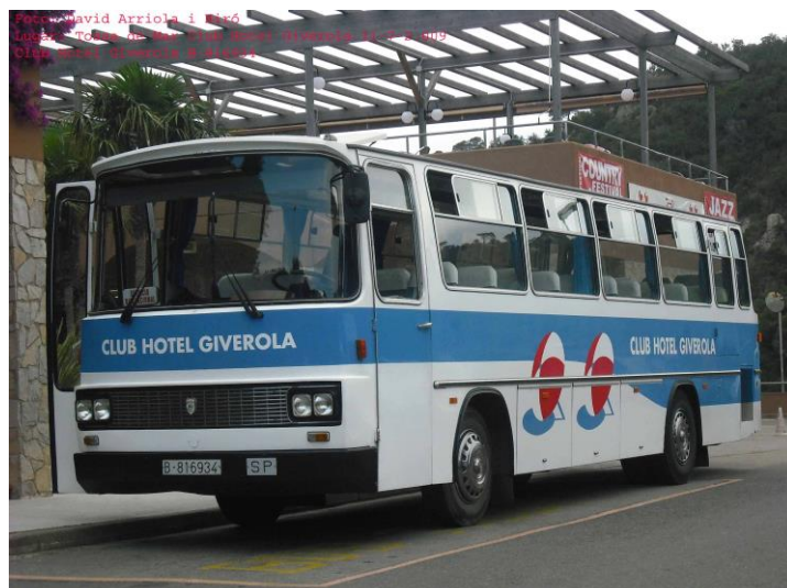
Bus (B-816934) Pegaso-6042 Maiso 2009-07(David Arriola) La última imagen que se tiene, posterior a las citadas de Carlos Martínez, esta tomada en el año 2009.